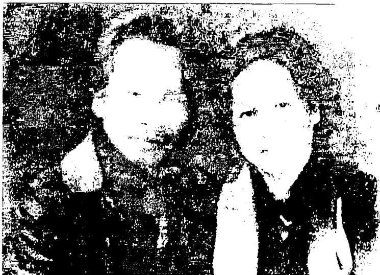
Vợ chồng Hoàng Minh Chính